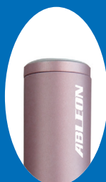
ローズ AX-B10 RO