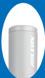
シルバー AX-B10 SV