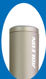
ゴールド AX-B10 GD