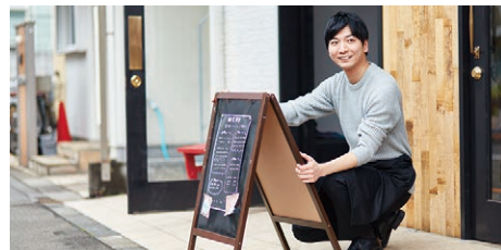
フロアが分かれた 店舗などで