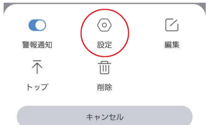
デバイス設定メニュー