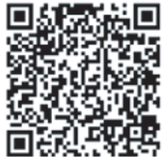
Google Play QR コード